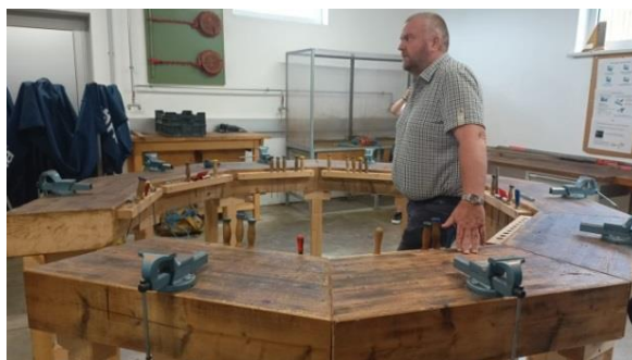
Част от съоръженията на LFS - Grabnerhof.

На 7-и следобед посетихме и планински район, където този център за обучение разработва проект за защита на овцете от нападения на вълци. Те изпитват техническа защита на стадото с типичен за района размер (в Щирия средно 20 животни в стадо):