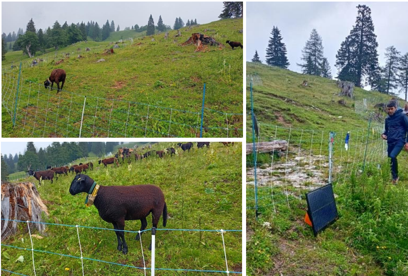
Свободна паша и защита през нощта посредством заграждения във високите райони на пасището

Посещенията бяха наистина обогатяващи, като се получи справочни данни и подходяща информация за разработването на IO2 („Насоки за преподавателите“).