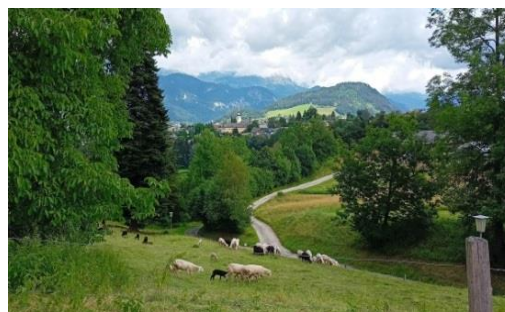
Die Fotos zeigen verschiedene Gebäude und Umgebung der Höhere Bundeslehr- und Forschungsanstalt