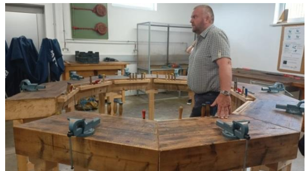
Die Fotos zeigen verschiedene Bereiche des Grabnerhofes.

Am Nachmittag diskutierten die Teilnehmenden direkt auf einer Alm Maßnahmen für den Herdenschutz. Im Rahmen eines Projektes werden Möglichkeiten des technischen Herdenschutz für die regional-typische Herdengröße von durchschnittlich 20 Tiere je Herde untersucht und evaluiert.