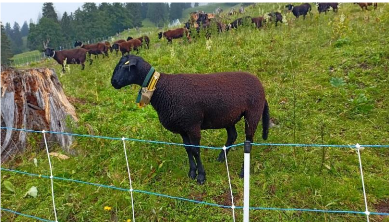
Diese Fotos zeigen die freie Beweidung mit Nachtschutz und Zaun auf den hochgelegenen Gebieten.